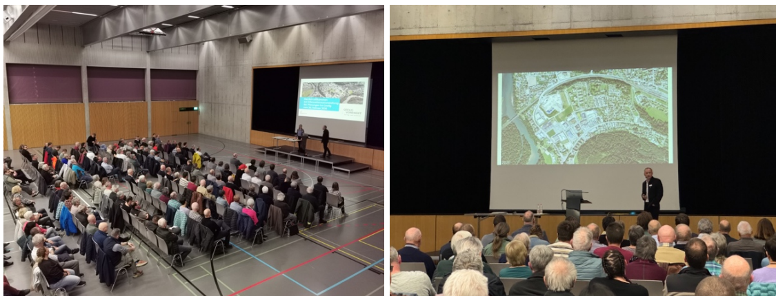
Rund 200 Interessierte folgten der Grussbotschaft von Gemeindeamman Toni Suter

Auch die Presse war mit dem Badener Tagblatt 1 resp. Aargauer Zeitung 2 , dem SRF Regionaljournal 3 und der Rundschau (regionales online Journal) vor Ort.